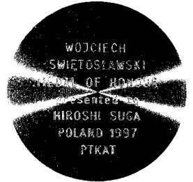
シフィエントスワフスキーメダルの表面（上）と裏面